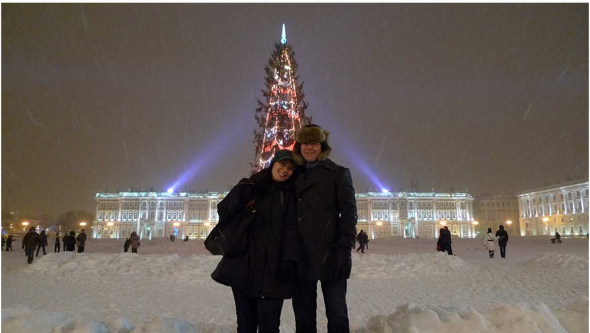
In front of Winter Palace on Palace Square in St Petersburg, 11th December. Дворцовая Площадь, Санкт-Петербург. 11 декабря. Framför Vinterpalatset på Palatstorget i St Petersburg den 11:e december.